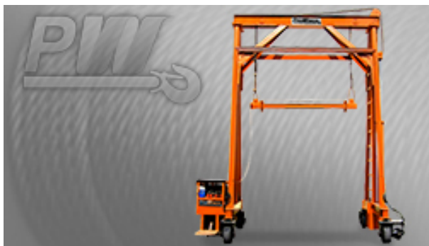
40 Tons Mobile Container Crane Diesel (Pair)